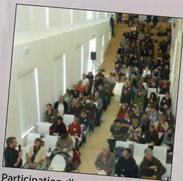
Participation d'enseignants des 5 EPL lorrains ainsi que d'étudiants du CS tourisme vert de Toul au 6 e Forum des acteurs du développement durable en Grande Région à Sion.