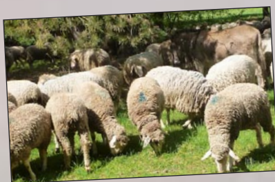
L'EPL 54 participe à un projet Interreg Grande Région sur la valorisation de la laine. Le projet a obtenu un avis favorable lors d'un premier passage en commission, l'avis définitif sera connu en octobre. Il s'agira d'organiser des formations transfrontalières ainsi qu'une collecte de laine « virtuelle » sur un site Internet, projet tout à fait innovant.

Présentation de l'enseignement et des établissements agricoles lorrains à Trèves (D) et Malmédy (B) auprès de représentants des Ministères de l'agriculture et de l'environnement.