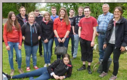
L'Agroécologie Tour a permis de mettre en contact direct nos apprenants avec des apprenants, enseignants et techniciens de la Grande Région. Lors de cette journée, une réunion a été organisée afin de discuter de projets futurs. Photo: les élèves luxembourgeois et leurs enseignants.

Participation à une journée d'échanges de pratiques en Communauté germanophone belge dont le thème était « les abeilles à l'école » et présentation des projets ou formations des établissements agricoles lorrains en lien avec les abeilles.