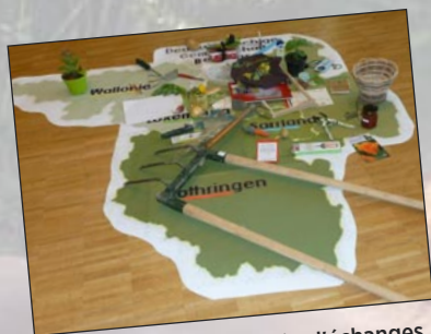
Participation à une journée d'échanges de pratiques à Trèves (D) sur les jardins scolaires et contacts avec de potentiels maîtres de stage.

faire connaître les 5 EPL lorrains, leurs formations et exploitations en Grande Région afin de créer un réseau qui facilite les échanges entre apprenants, professionnels, enseignants et chefs d'exploitations des 6 sous-régions. Ci-dessous, quelques actions en images.