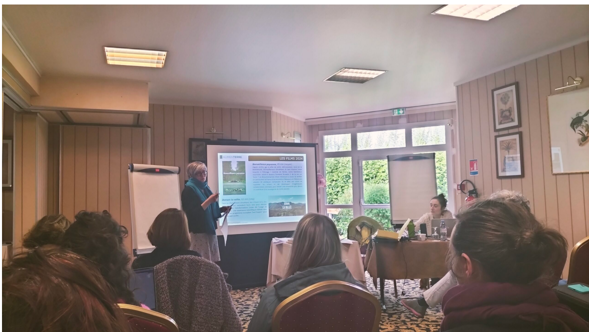
Elaboration des fiches films pour la sélection 2024.

Du 3 au 5 avril, Vendôme a accueilli le séminaire national AlimenTERRE, rassemblant les coordinations territoriales et les enseignants de l'Enseignement Agricole. Organisé conjointement par CENTRAIDER , le Comité Français de Solidarité Internationale (CFSI) , l' Institut Agro campus de Florac et le Réseau d'Éducation à la Citoyenneté et à la Solidarité Internationale du Ministère de l'Agriculture et de la Souveraineté Alimentaire, cet événement avait pour thème central « La démocratie alimentaire ».