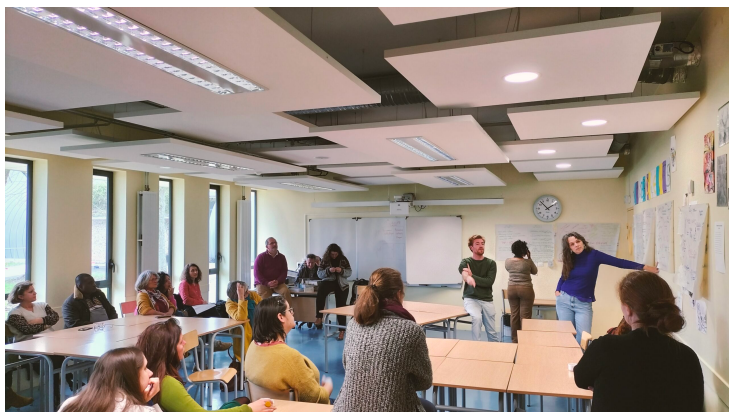
Restitution du World Café

La matinée s'est prolongée par un atelier »World Café » pour explorer les enjeux de la démocratie alimentaire.