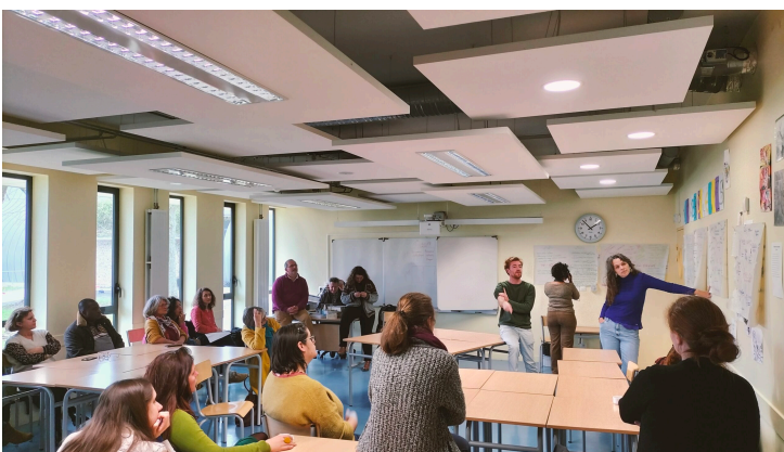
Restitution du World Café