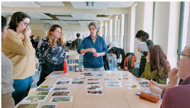
La face cachée de la pâte à tartiner industrielle