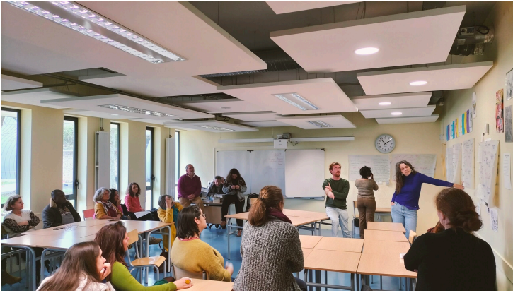
Restitution du World Café