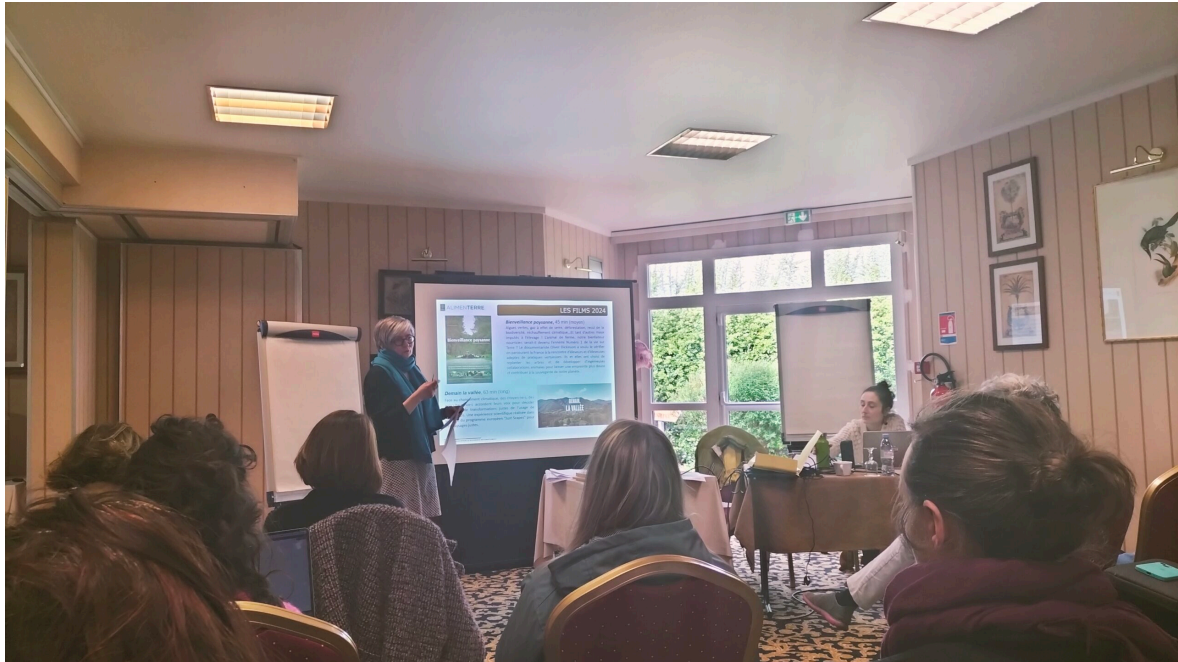
Elaboration des fiches films pour la sélection 2024.

séminaire national AlimentERRE, rassemblant les coordinations territoriales et les enseignants de l'Enseignement Agricole. Organisé conjointement par CENTRAIDER , le Comité Français de Solidarité Internationale (CFSI) , l' Institut Agro campus de Florac et le Réseau d'Éducation à la Citoyenneté et à la Solidarité Internationale du Ministère de l'Agriculture et de la Souveraineté Alimentaire, cet événement avait pour thème central « La démocratie alimentaire ».