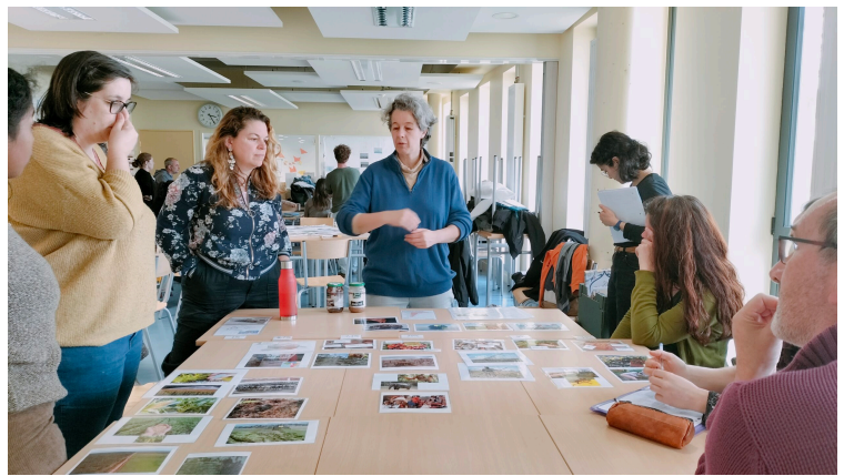
La face cachée de la pâte à tartiner industrielle