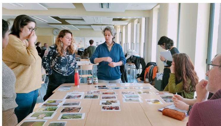
La face cachée de la pâte à tartiner industrielle