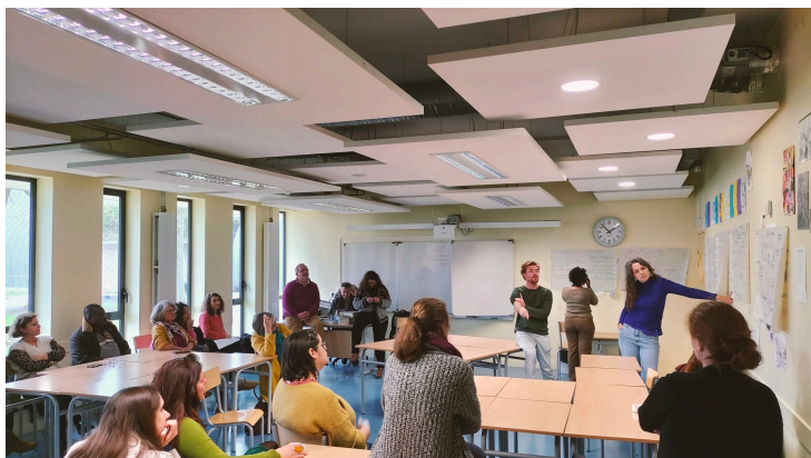
Restitution du World Café

La matinée s'est prolongée par un atelier »World Café « pour explorer les enjeux de la démocratie alimentaire.