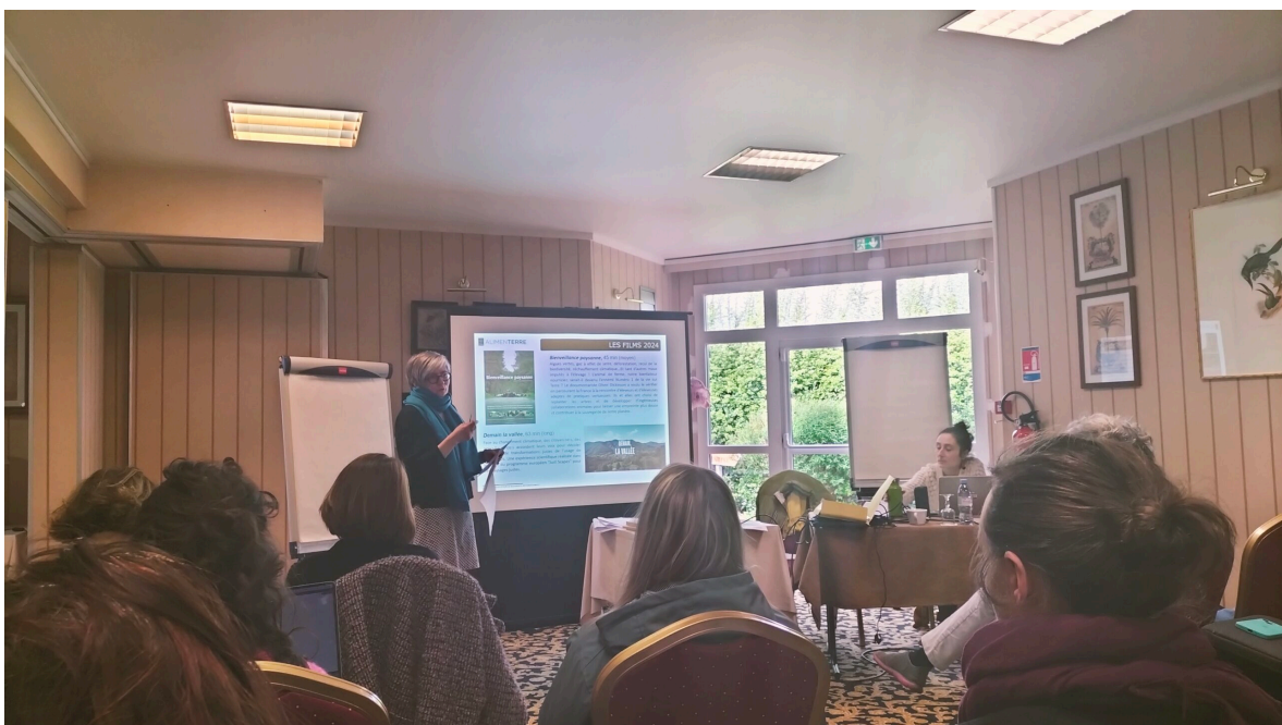
Elaboration des fiches films pour la sélection 2024.

Du 3 au 5 avril, Vendôme a accueilli le séminaire national AlimenTERRE, rassemblant les coordinations territoriales et les enseignants de l'Enseignement Agricole. Organisé conjointement par CENTRAIDER , le Comité Français de Solidarité Internationale (CFSI) , l' Institut Agro campus de Florac et le Réseau d'Éducation à la Citoyenneté et à la Solidarité Internationale du Ministère de l'Agriculture et de la Souveraineté Alimentaire, cet événement avait pour thème central « La démocratie alimentaire ».